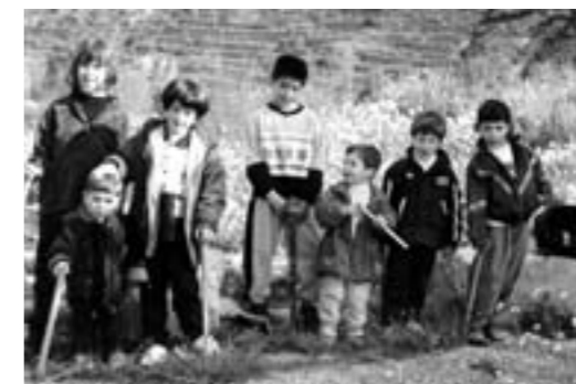
Nens de Copons al la zona de l'abocador de runes preparats per a plantar els plantons.

Cal agrair la col·laboració del viver municipal de Vilanova del Camí, que ens va proporcionar els petits arbres.