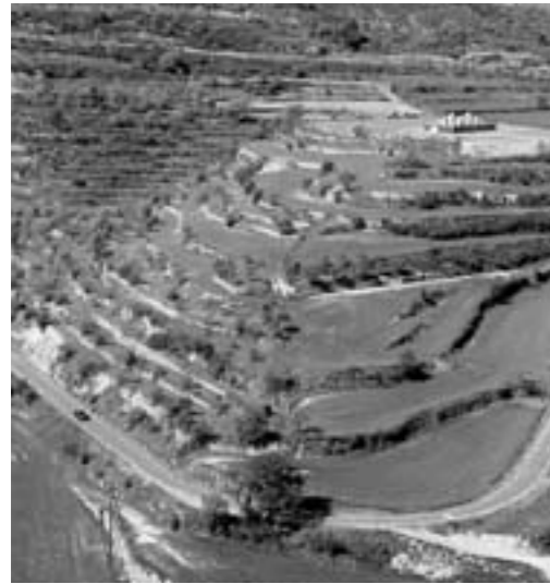
Vista de les feixes i el Circ