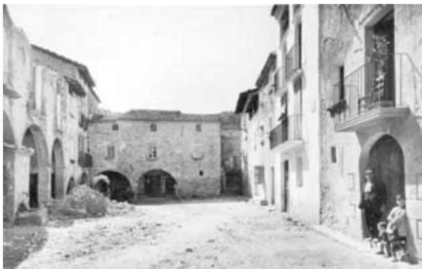
Plaça Ramon Godó, 1935 (Magdalena Parés)