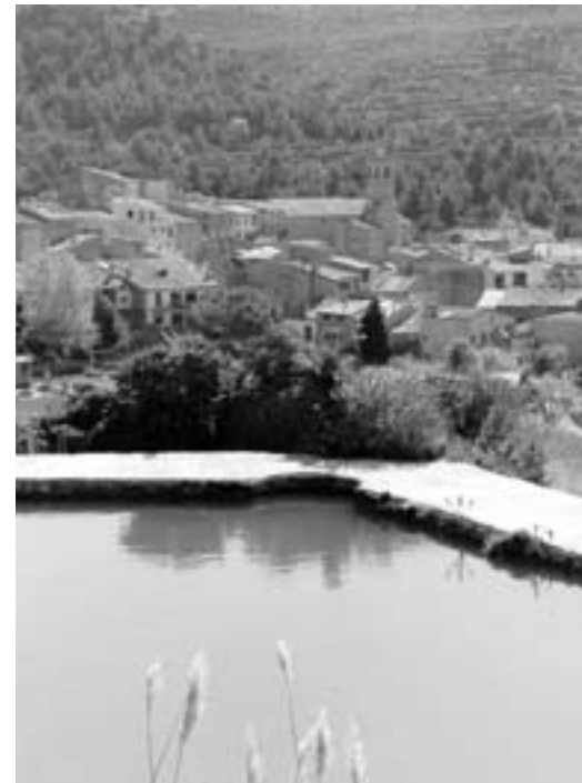
Vistes de la bassa dels horts

La vila de Copons mai ha seguit cap mena de sistema de regadiu. Els regants utilitzaven l'aigua lliurement sense tenir en compte els milers de litres que es perdien. Aquesta situació i la progressiva manca d'aigua ha ocasionat la creació d'una junta de regants par tal d'evitar els conflictes. Un dels principals conflictes era que alguns regants utilitzaven més aigua de la necessària, cosa que provocava que els altres propietaris no poguessin regar. És per això que l'associació per la conservació dels recs, molins i horts de Copons va proposar uns objectius que igualessin els drets de tots els propietaris: