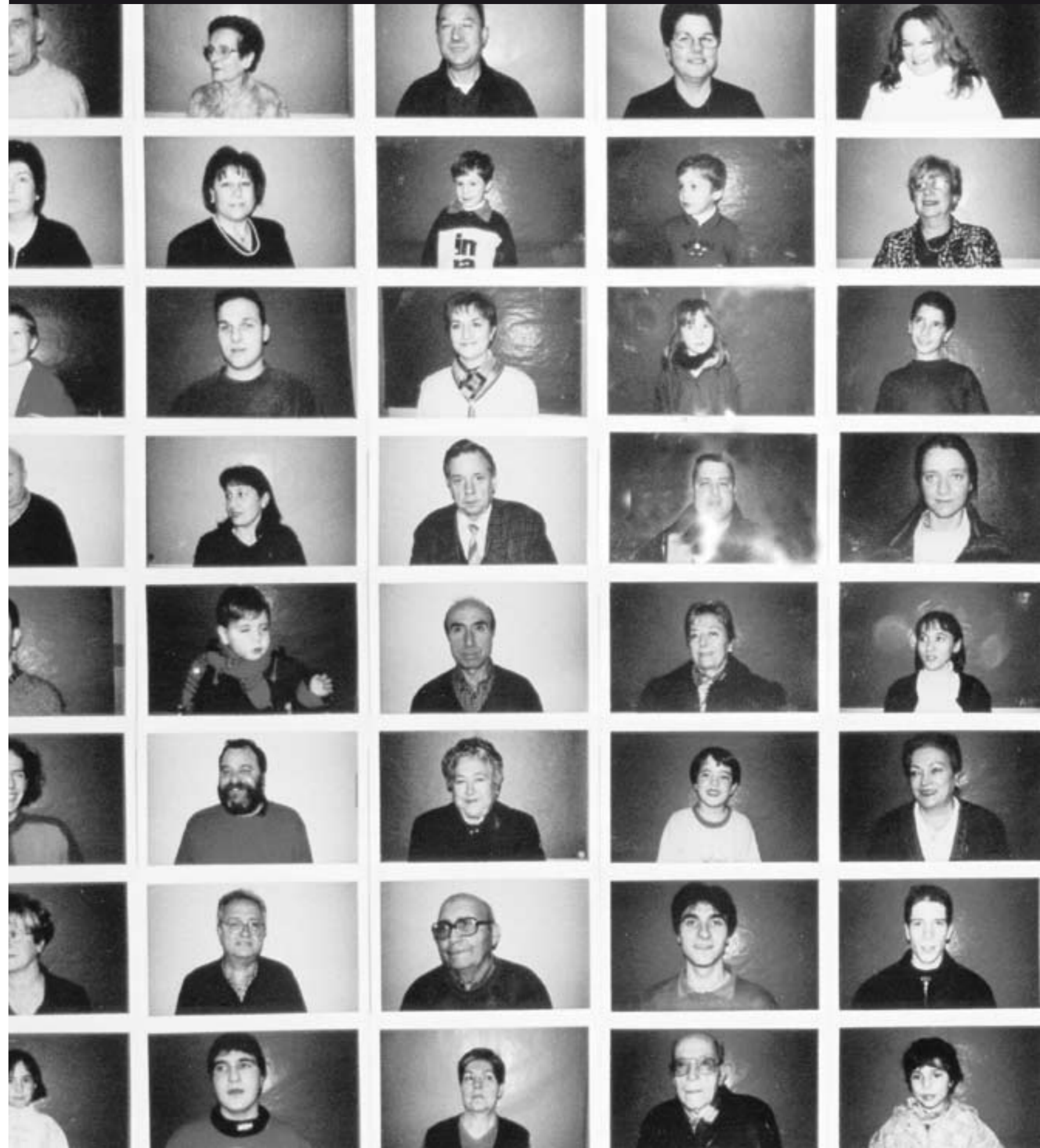
Detall del mural de fotografies "Copons 2000"