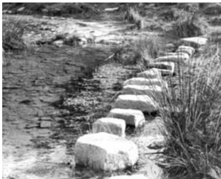
Passeres, 1969 (Mossèn Joan Freixenet)