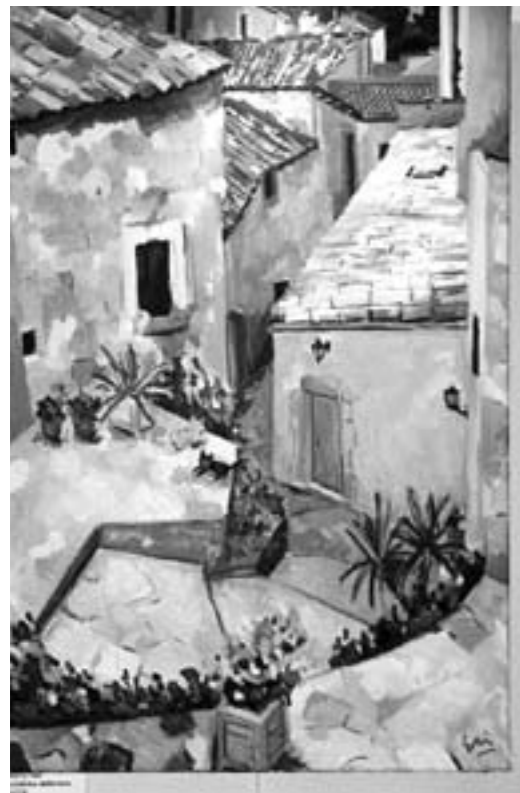
Oli de Javier Martí Ferrer Oli d'Eisenda Mercadal

Copons va rebre el nou mil.lenni amb dues interessants i originals exposicions, que es van inaugurar el diumenge 2 de gener a la tarda, a la sala d'actes i vestíbul de l'Ajuntament.