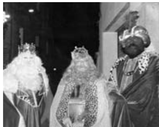
Els Reis d'Orient en diferents moments a Copons

Esperem que tots aquests canvis hagin estat per bé i que hagin agradat a tothom. Des d'aquí volem fer saber a tothom qui ho vulgui, que la Comissió de Reis està oberta a noves iniciatives i que qualsevol idea serà ben rebuda.