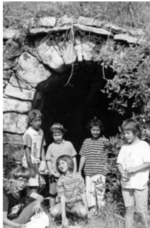
Excursió a la barraca

Text: Alumnes de l'escola d'estiu