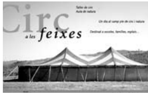
Targetó de presentació del Circ