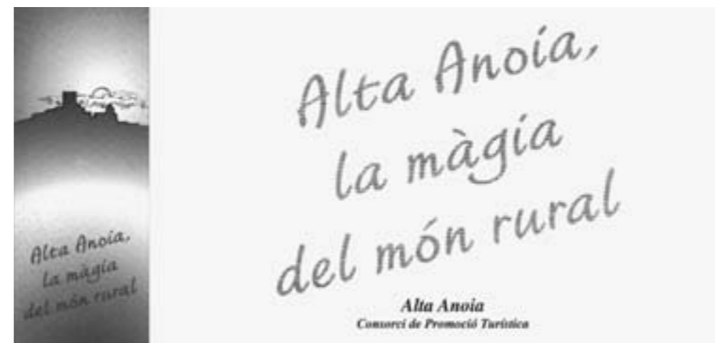
Programa Alta Anoaia al Palau Robert

L'objectiu de convertir l'Alta Anoaia en una destinació turística atractiva no s'aconsegueix en dos dies sinó que es tracta d'una cursa de llarga duració, dels municipis que hi participen.