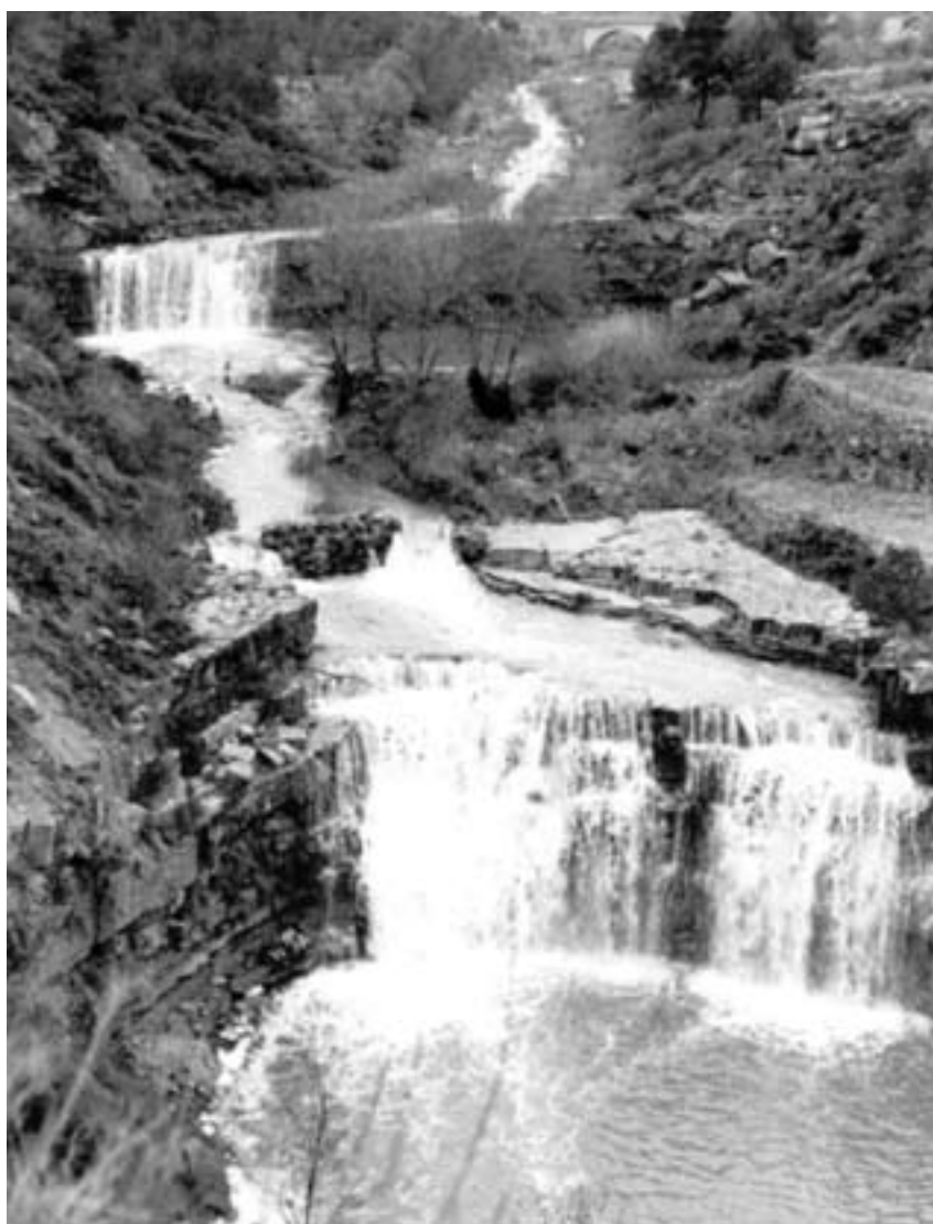
Riera de Sant Pere, 1969 (Mossèn Joan Freixenet)